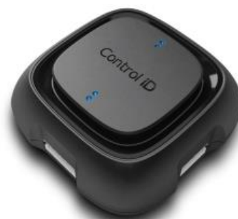
( Módulo de Acionamento )